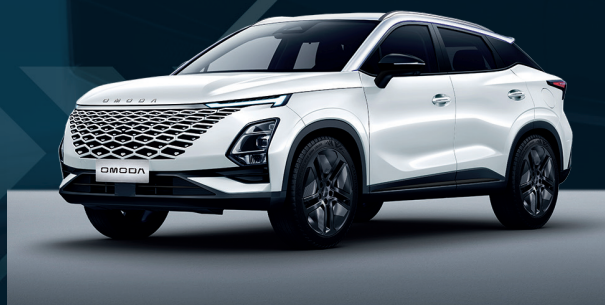
Khaki White Dla wersji Comfort