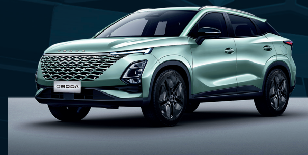
Aqua Green Dla wersji Comfort i Premium