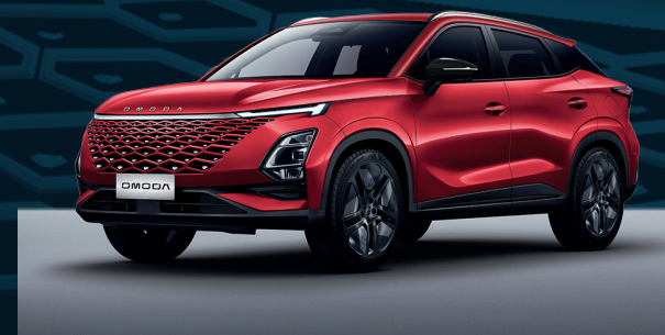
Blood Red Dla wersji Comfort i Premium