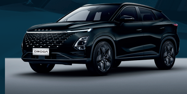
Carbon Black Dla wersji Comfort i Premium