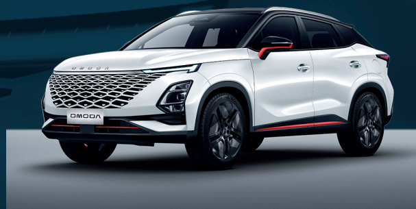
Khaki White z czerwonymi akcentami i czarnym dachem Dla wersji Premium