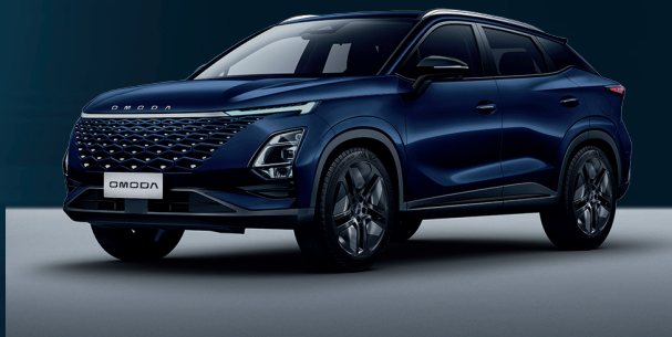
Midnight Blue Dla wersji Comfort i Premium