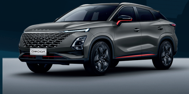
Phantom Gray z czerwonymi akcentami Dla wersji Premium