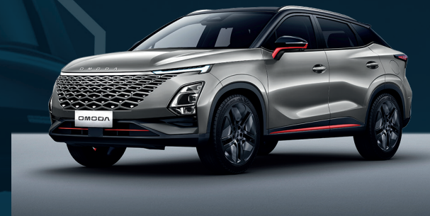
Aviation Silver z czerwonymi akcentami i czarny dachem Dla wersji Premium