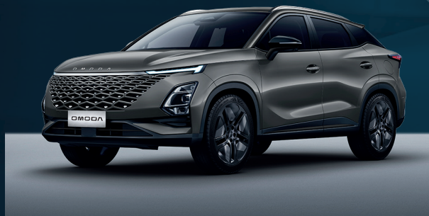
Phantom Gray Dla wersji Comfort