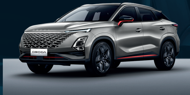
Aviation Silver z czerwonymi akcentami Dla wersji Premium