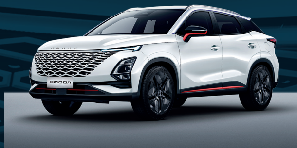
Khaki White z czerwonymi akcentami Dla wersji Premium