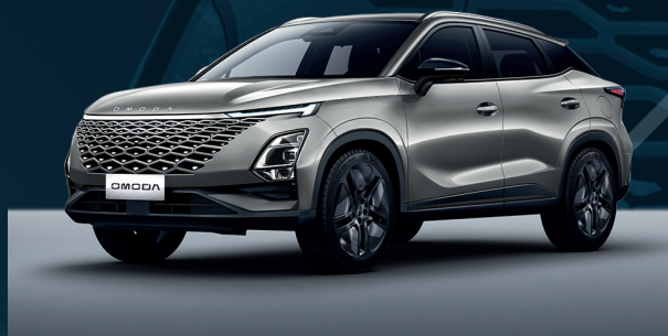
Aviation Silver Dla wersji Comfort

I co najważniejsze, niezależnie jaki kolor wybierzesz, nie dopłacasz za niego.