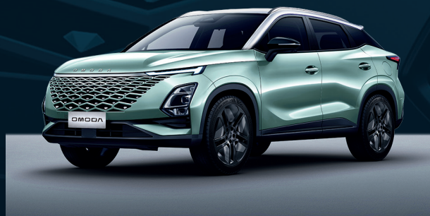
Aqua Green z białym dachem Dla wersji Premium

Czerwone elementy znajdują się na podstawach lusterek bocznych, dolnej krawędzi wlotu powietrza oraz na listwach bocznych drzwi